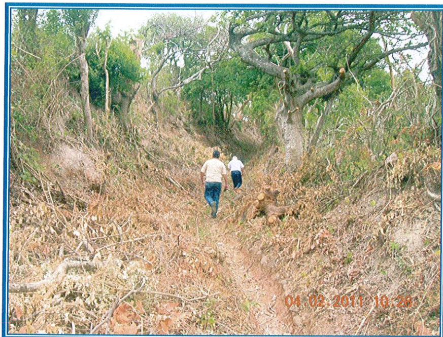
ACCESO A TERRENO DONDE SE CONSTRUIRA TANQUE.