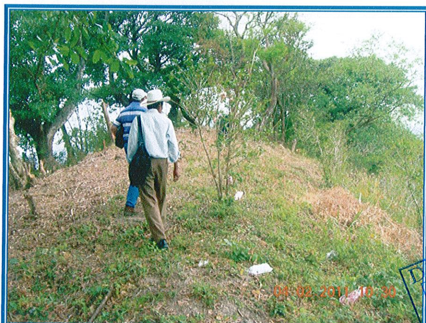
TERRENO DONDE SE CONSTRUIRA EL TANQUE